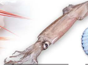
Patagonian squid Loligo gahi