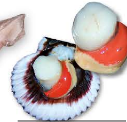
Scallop Argopecten purpuratus