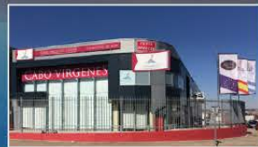
Headquarters in Palencia