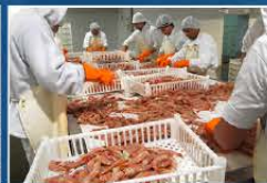
Processing in Rawson