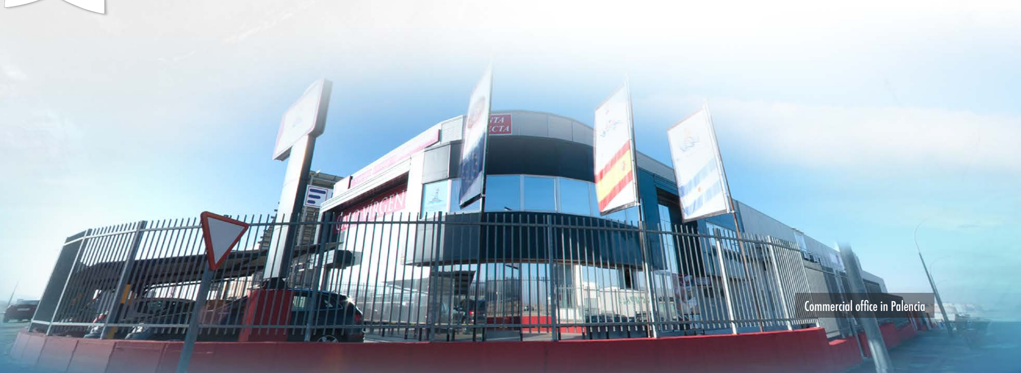
Commercial office in Palencia

We have facilities in Port Rawson (Chubut - Argentina), Perú... and Palencia (Spain)