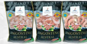
Doy-pack: 800g, 1Lb, 2Lb.