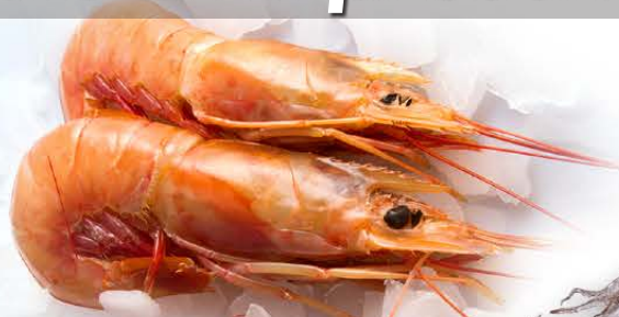
Argentinian red shrimp Pleoticus muelleri