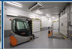
Logistics in Palencia