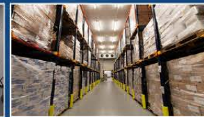
Logistics in Palencia