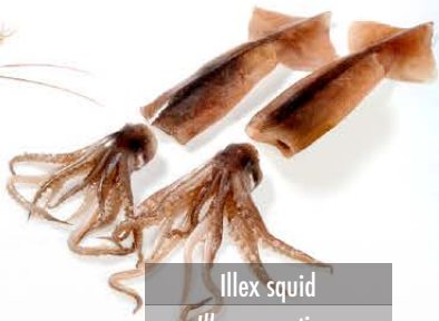
Illex squid Illex argentinus