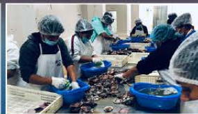
Factory in Piura