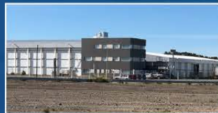
Factory in Argentine