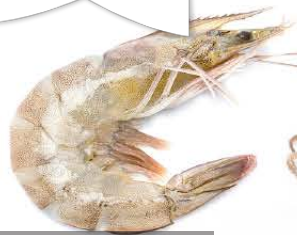
Vannamei Penaeus vannamei