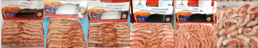
L1 (10-20 PPKG) L2 (20-30 PPKG) L3 (30-40 PPKG) C1 (30-55 PPKG) C2 (55-100 PPKG) CR Broken (30-100 PPKG)

Standard formats boxes in master box: 6 x 2Kg 12 x 1Kg 10 x 800gr 20 x 400gr