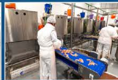
Reprocessing in Palencia