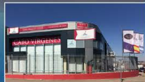
Sede central en Palencia