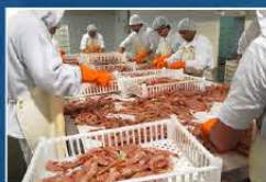
Procesado en Rawson