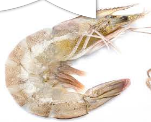
Vannamei Penaeus vannamei