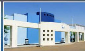
Fábrica en Sonora