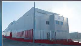
Fábrica en Palencia