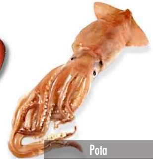
Pota Dosidicus gigas