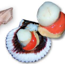
Vieira Argopecten purpuratus