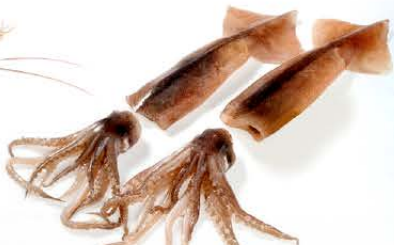
Calamar Illex Illex argentinus