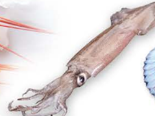
Calamar patagónico Loligo gahi