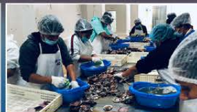
Fábrica en Piura