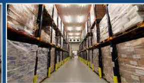
Almacén en Palencia