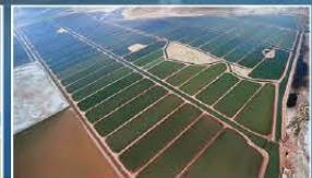
Piscinas en Sonora