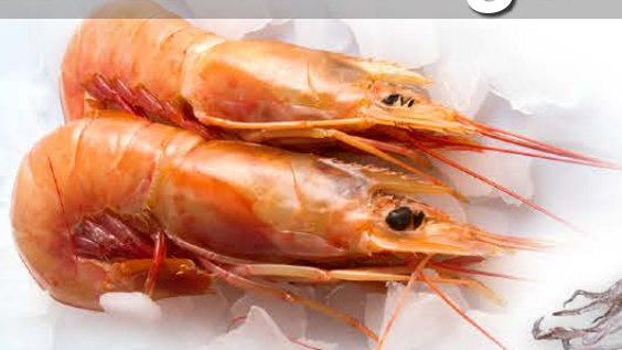
Gambón austral Pleoticus muelleri