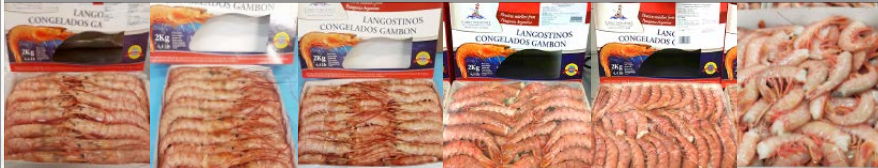
L1 (10-20 PPKG) L2 (20-30 PPKG) L3 (30-40 PPKG) C1 (30-55 PPKG) C2 (55-100 PPKG) CR Broken (30-100 PPKG)

Formatos estándar en caja master: 6 x 2Kg 12 x 1Kg 10 x 800gr 20 x 400gr