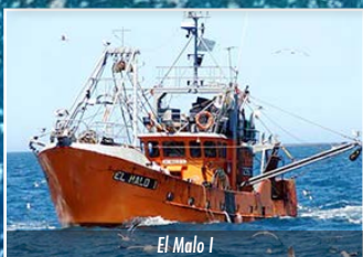
El Malo I