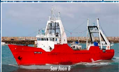
San Juan B