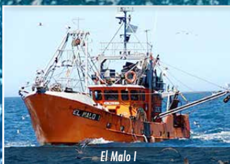
El Malo I