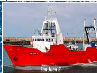
San Juan B