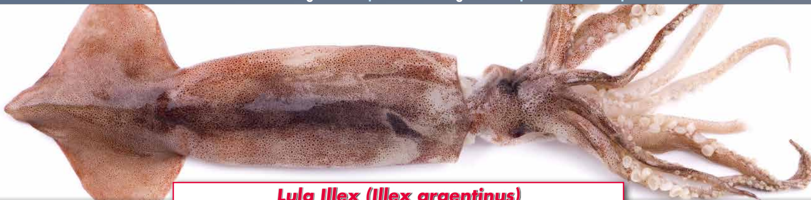
Lula Illex (Illex argentinus)

Origem: Argentina. Zona FAO: 41. Método de produção: Pesca extractiva. Arte de pesca: Anzóis e aparelhos de anzol.