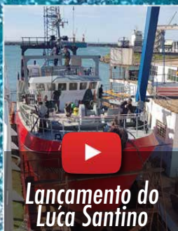
Lanzamiento do Luca Santino