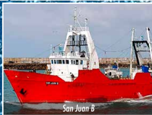
San Juan B