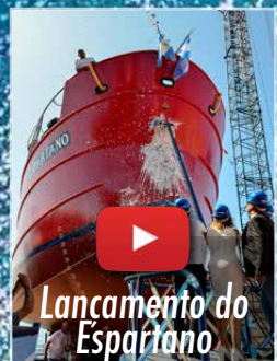
Lanzamiento do Espartano